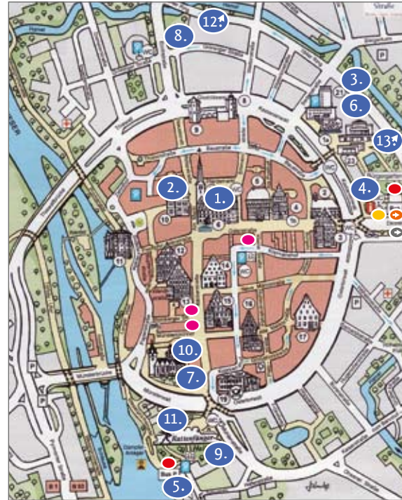
Titelbild und Plan: Hameln Marketing