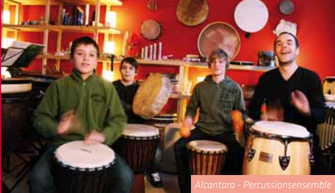
Alcantara - Percussionsensemble