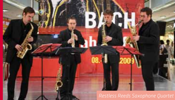
Restless Reeds Saxophone Quartet